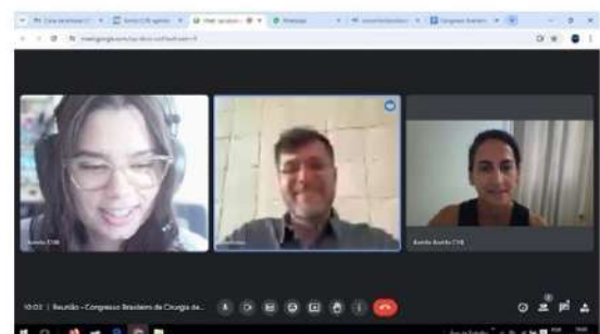
Congresso Brasileiro de Cirurgia de Ombro e Cotovelo.